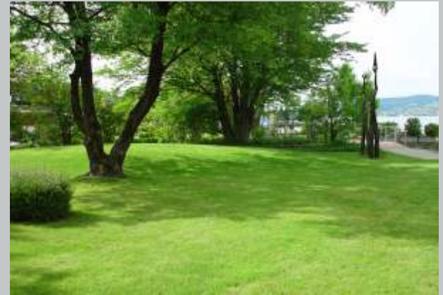
am Tag ...